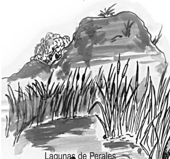
Lagunas de Perales